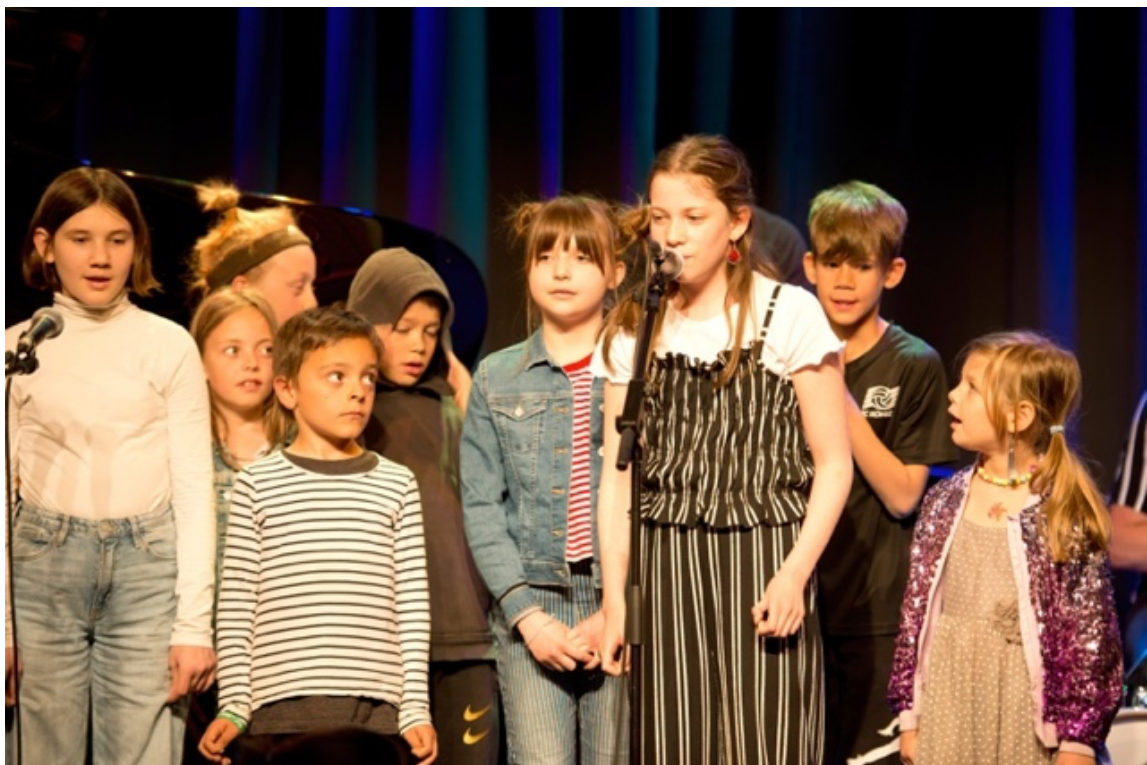
Ad hoc Kinderchor – das könnte Ihre Schulklasse sein